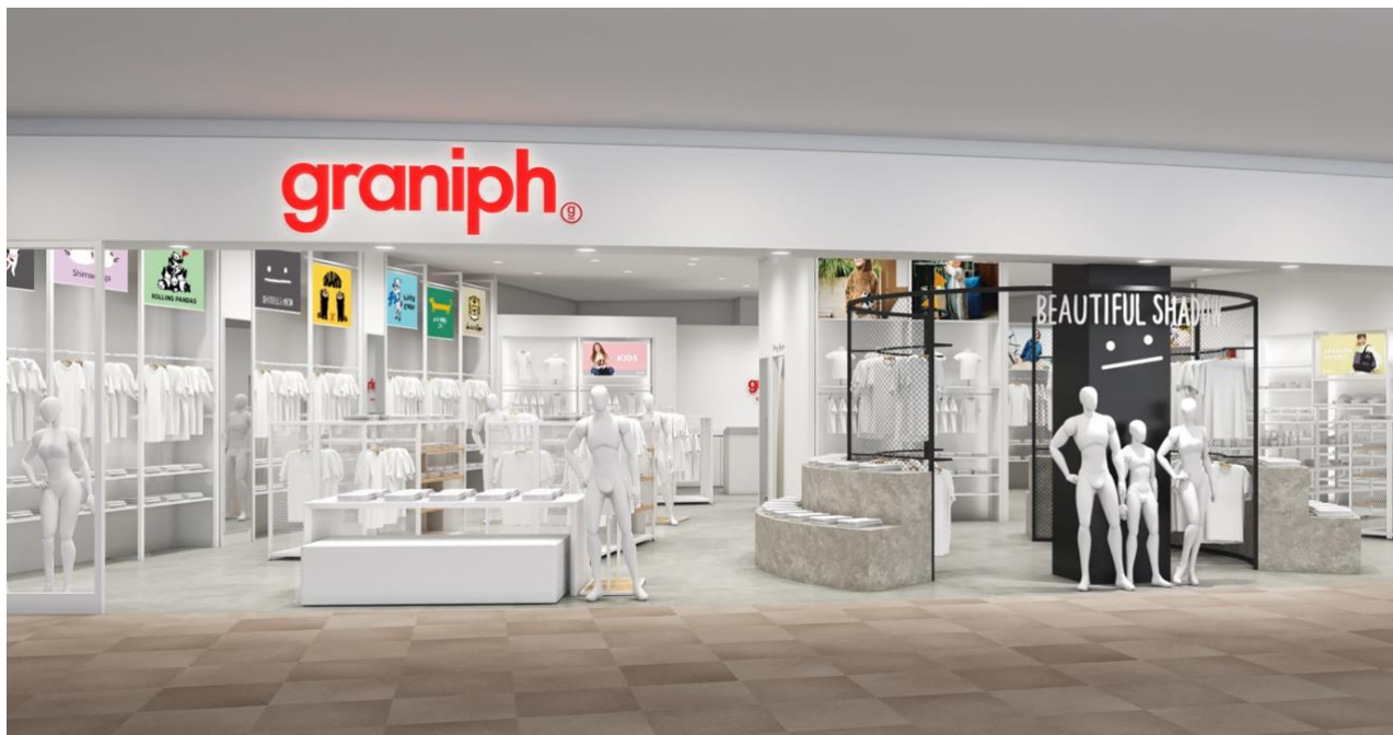
グラニフ ららぽーと EXPOCITY 店 イメージ

人気 No.1 オリジナルキャラクター「ビューティフルシャドー」ゾーンも新登場。 リニューアルオープン記念のお買い上げプレゼントや、会員 10%OFF キャンペーンを開催。